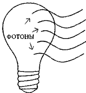
Лазер (когерентный свет)

окружающим миром. IT-сознание порождает гармонию и не причиняет вреда.